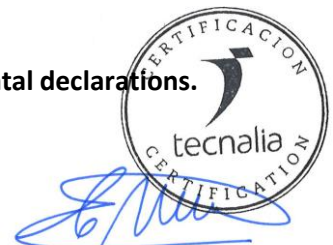
Carlos Nazabal Alsua Manager

Issued date / Fecha de emisión: 02/03/2023 Update date / Fecha de actualización: 02/03/2023 Valid until / Válido hasta: 01/03/2028 Serial N o / N o Serie: EPD0260400-E