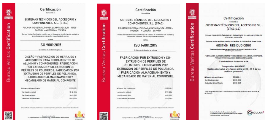
Figura 1. ISO 9001, ISO 14001 y certificado Zero Waste

Nombre(s) y ubicación(es) de la(s) planta(s): C/ Isaac Prado Bodelón, Parcela 2 Polígono Industrial de La Rozada, Viladecanes 24516, Parandones, León, España